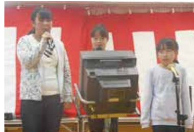
(お子さんの参加もあったよ)

1月17日(日)午後1時より、今回で12回目の「新春カラオケ大会」が大会議室で開催されました。47組の出演者の競演と、大勢の来場者で大いに盛り上がり、午後5時終演後、地域の会社、商店等から頂いた協賛賞品を出演者全員に授与されました。途中休憩時には、当館特製の「ぜんざい」と「一銭焼き」が振舞われました。