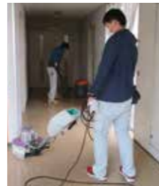
(廊下のワックス掛け)