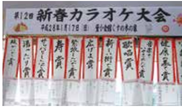
(協賛各社よりの賞品目録)