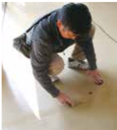
(フロアの汚れ落とし)

3月20日(日)全館休館とし、新年度を控え業者に依頼して、ワックス掛けを実施しました。これからも当会館をきれいに使用いただけるようよろしくお願いします。