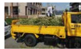
(切り落とされた小枝の積み出し)

先ず、5月30日(日)午前8時より正午過ぎまで、10名の有志により、垣根や低木の剪定を実施。また、10月2日(金)~5日(月)にかけて、業者と委員有志の皆さんで高木剪定を行いました。切り落とされた小枝はなんと1トン。細かく刻んで焼却場へ運びました。お疲れ様でした。そして有難うございました。