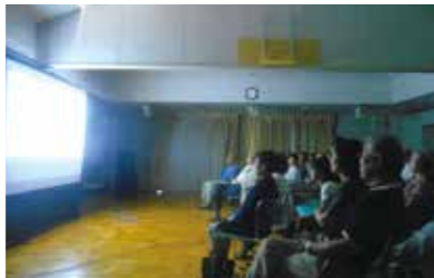
(名画の会を楽しむ来場者)

日曜の午後はコミセンで楽しむと第1回は6月28日「サウンドオブミュージック」。第2回は10月25日「麗しのサブリナ」となつかしい名画を上映しました。両日とも60名を超す観衆。ご年配の方が多く、若かりし頃を思い出してか、また、次回を期待する思いからか、終映後、大拍手が起こりました。