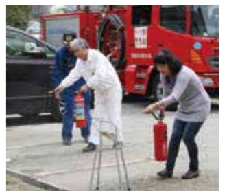
(初期消火訓練の様子)

サークル懇談会終了後、昼食をはさんで、5月18日(土)午後1時より、サークルの代表者、管理運営委員ほか、40名超の参加者を得て、箕面消防署指導のもと、消防訓練を実施しました。室内にて、調理室から出火の想定で、消防署への適格な通報訓練を行い、駐車場で実際に消火器を使用しての初期消火訓練を実施しました。