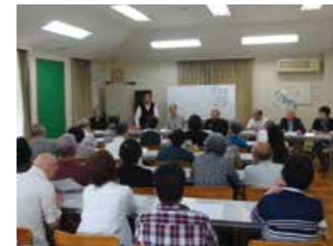
(出席したサークル代表者の皆さん)

5月18日(土)午前10時より、日頃、当会館を利用いただいているサークルの代表と管理運営委員会役員との懇談会を開催しました。目的は、いかにきれいに気持ちよく利用していただくための意見交換と常識的なルール徹底をお願いしています。今回も44サークルの代表者が出席され、活発なご意見を頂戴しました。今後、当会館運営に反映していきます。有難うございました。