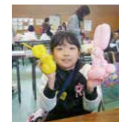
(上手に出来上がりました)

11月29日 午前10時より萱野小学校で開催されました。早朝まで降り続いた雨も上がり、肌寒い日でしたが、それでも150余名の生徒が、元気に参加しました。工作のテーマは“バルーンアート”「バルーンアートクラブみのお」の方々の指導で、細長いふうせんをふくらまし、それを折って犬やウサギなど小動物を作りました。憩いの広場でゲームや遊戯をしました。合間に、民生委員、青少年を守る会他の皆さんが、早朝から焼いてくれた熱い「焼き芋」をいただきました。