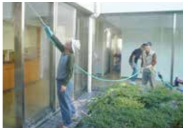
(中庭ガラスの水洗い)

10月26日(日)午前9時から、全館内外の大掃除を実施しました。日頃当会館を利用しているサークルの内、17サークルの代表の皆さんにも参加いただき、委員も30数名加わり、隅から隅まですっかりきれいになりました。幸い好天に恵まれ、作業も順調に進み、約2時間で完了しました。参加の皆さん、本当に有難うございました。これからは“きれいに使用すること”を心掛けましょう。