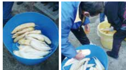
(塩漬けした大根と糠漬け樽)

今回の参加者18名でスタート。10月24日(金)午前10時より渋柿を収穫。皮をむいて実は吊るし柿にし、皮は糠漬けに入れるために干す作業をしました。12月14日(月)80本の大根を仕入れ、過去のやり方と異なり、今回は2つの樽に塩漬けにしました。かなり重い石をのせ、水の上がり具合を見ながら、後日糠漬けにする準備をしました。12月3日(水)晴天でしたが、寒風吹くなか、塩漬けにした大根をみかん、柿の皮や塩を混ぜた糠に漬け、しっかりした重石をのせました。この正月明けには美味しいたくあんがいただけます。