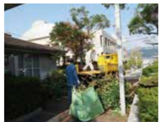
(切り取った小枝を焼却場へ)

11月7日(金)午前8時から、管理運営委員会有志で、館外の高木剪定を行いました。当会館は「くすの木の家」のニックネームのように、“くすの木”や“やまもも”“もみじ”など高木が40本ほどあり、緑豊かな環境にありますが、少し油断をするとこれらの木々が、直ぐに生い茂り、館内を暗くするので年1回の剪定は欠かせません。先週、先々週に部分的に剪定しておりましたので、今日は一日掛かりで終了できました。冬を迎えるのも大変です。有志の皆さん、お疲れ様でした。