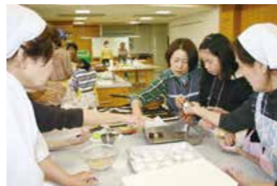
(母子連れでゴマ団子作ろう)

一方、お菓子作り教室は、同日午後1時より「みのおライフプラザ」調理室で開かれました。榎原先生指導のもと、5班に分かれ“フライパンで作る