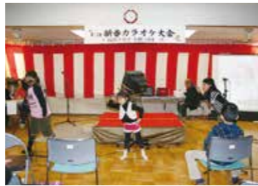
(子どもさんの熱演)

1月19日(日)午後1時より大会議室に於いて世代間交流を目的とした「新春カラオケ大会」が開催されました。子どもさん達のアニメソング、ギター演奏、若いお母さん方のデュエット、年配の方々の演歌、詩吟など豊富な内容で、午後5時、43組の熱演が和やかな雰囲気の中で終了。今回は10回目という節目の大会で地