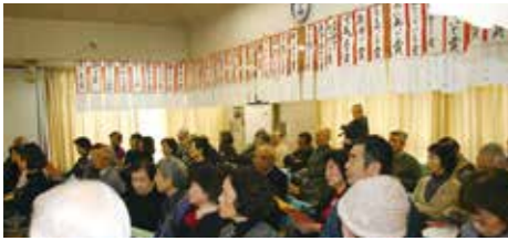
(協賛社よりの賞品目録と観衆)

1月19日(日)午後1時より大会議室に於いて世代間交流を目的とした「新春カラオケ大会」が開催されました。子どもさん達のアニメソング、ギター演奏、若いお母さん方のデュエット、年配の方々の演歌、詩吟など豊富な内容で、午後5時、43組の熱演が和やかな雰囲気の中で終了。今回は10回目という節目の大会で地