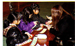
(工作風景とサイコロ)

2月23日(土)午前9時半、150名余のこどもたちが参加し第44回「つくってあそぼう! かやのキッズ!」が萱野小で行われました。工作のテーマは「パズルdeサイコロ」3枚の短冊にサイコロの目を書き、鎖状に結んで折りたためばサイコロの出来上がり。中庭では、「餅つき」が行われ、こどもたちも元気よく重い杵を振り上げながら、餅をつきました。(こどもたちの餅つき) こどもと地域が一体となった楽しい半日でした。