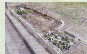
駐 車 場 入 り 口 花 壇