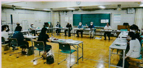
新規運営委員への説明会